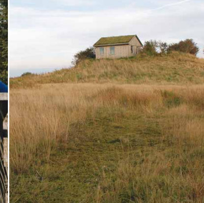
Infohütte auf dem »Richi-Hügel«