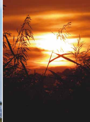
Reet im Gegenlicht