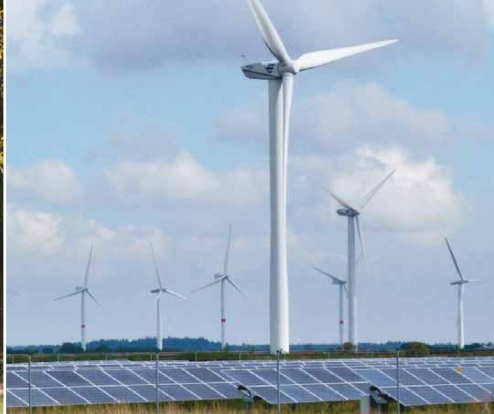
Windkraft und Fotovoltaik