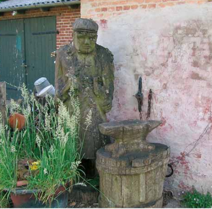
Alte Schmiede Lütjenholm